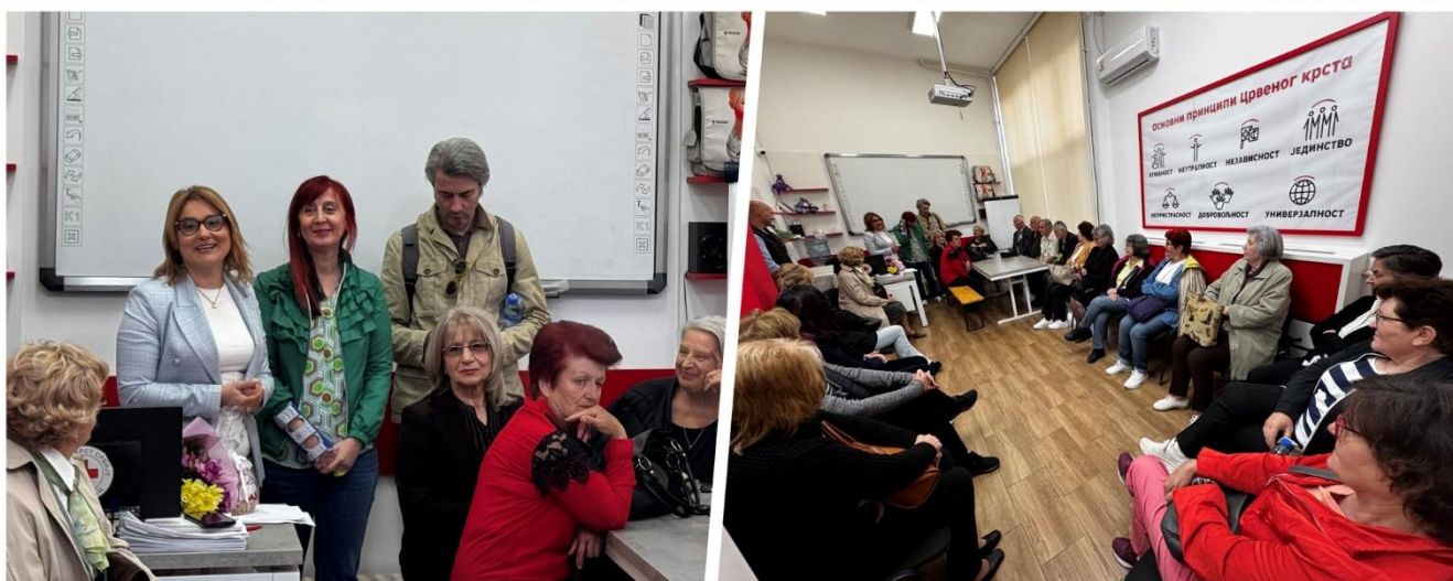
Сегменти забележени током радне посете Црвеног крста Србије, ЦК Алексинац и ЦК Велика Плана, у Крушевцу – 2025.

У оквиру пројекта „Смањење дигиталног јаза“, У Крушевцу је потписан Меморандум о сарадњи са циљем унапређења дигиталних знања и вештина старијих особа, промоције здравог и активног старења , те подстицања волонтирања и међугенерациске солидарности . Крушевац је једна од укупно шест локалних самоуправа укључених у овај пројекат која је потписала споразум.