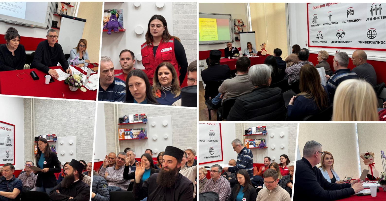
(Седница годишње скупштине Црвеног крста Крушевац – 2025. године)

Сви запослени Црвеног крста Крушевац посебно су обучени за рад на рачунару у информатичком, пословно-финансијском систему Црвеног крста Србије, успешно су завршили обуку за деловање у несрећама и припадници су Окружне јединице за деловање у несрећама, као и за пружање психо-социјалне подршке и психолошке прве помоћи. Обучени су за организовање и спровођење акција добровољног давања крви, за вођење евиденције о добровољном давалаштву крви. Међу запосленима двоје је лиценцираних инструктора и предавача прве помоћи. За наредни период планирано је даље усавршавање запослених и волонтера за делокруг рада Црвеног крста. Стручно усавршавање је обавеза свих запослених. На тај начин се стичу нова знања, вештине и унапређује стручни рад.