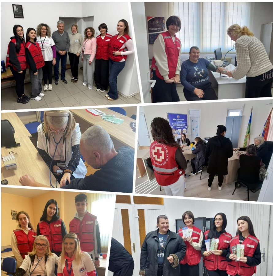
Сегменти забележени током здравствено-превентивних активности у сарадњи са Домом здравља Крушевац – службом за поливалентну патронажу – 2025.

Свестски дан срца у 2025. години обележен је у знаку јубилеја – 25 година од првог обележавања овог значајног датума. Од тада до данас, ова иницијатива је значајно допринела подизању свести о болестима срца и крвних судова и њиховом утицају на квалитет живота становништва, отварајући разне теме специфично везане за ову групу болести, од фактора ризика и мера превенције до специфичности срчаних болести у односу на пол и узраст. Болести срца и крвних судова представљају водећи узрок смрти у свету, доминирају срчани и мождани удар који су удружено чинили чак 85% забележених смртних исхода од кардиоваскуларних болести у свету у 2022. години. У Србији, последњи подаци из 2024. године указују да су болести система крвотока чиниле 47,7% свих смртних исхода.