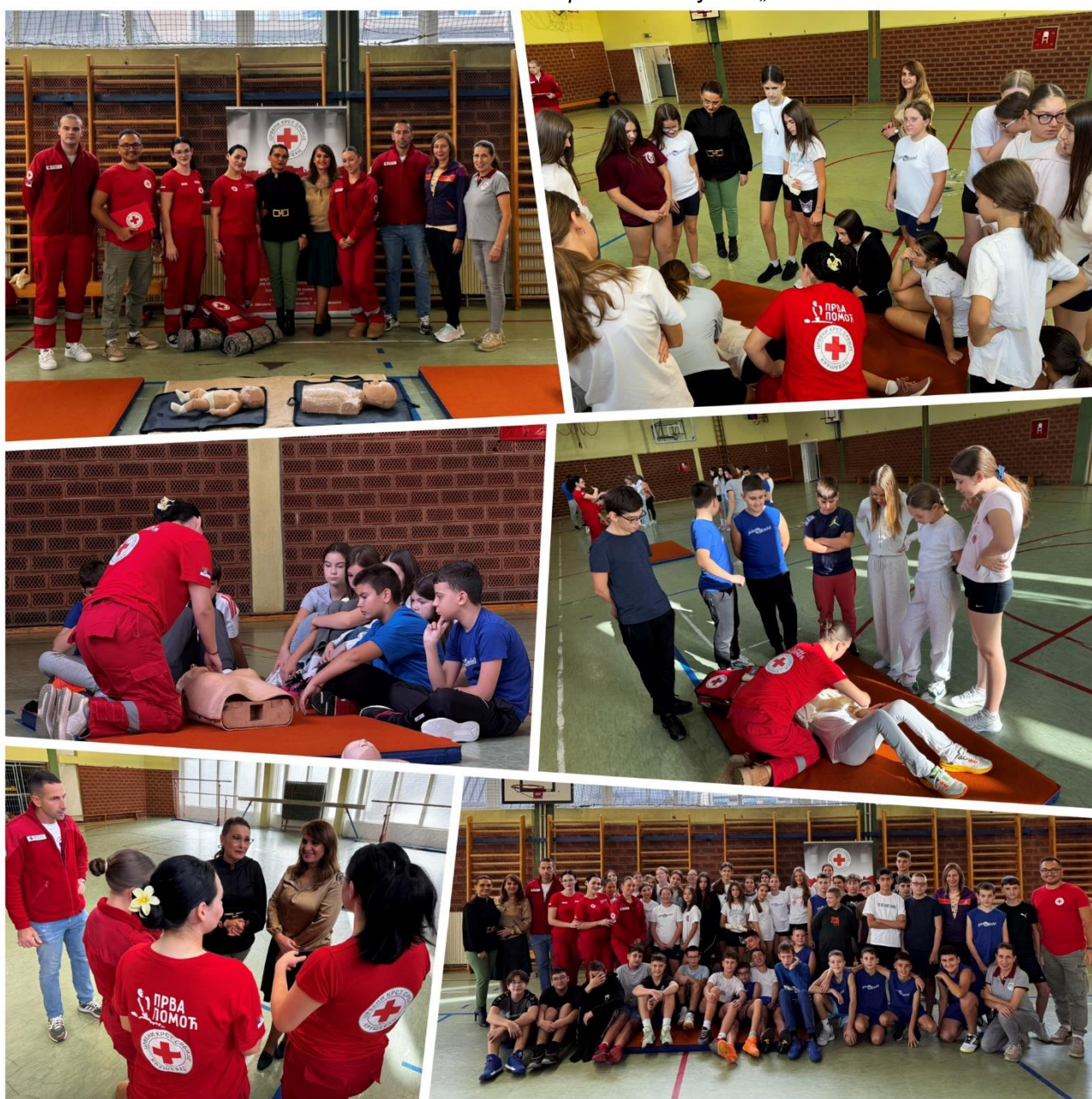
Сегменти забележени током активности прве помоћи у ОШ „Јован Поповић“ – 2025.

Циљне групе су грађани оних категорија који су изложени повећаном ризику од повреда због врсте посла, учесници у саобраћају, осетљиве категорије као што су деца и млади и волонтери Црвеног крста који се ангажују на реализацији активности програма прве помоћи.