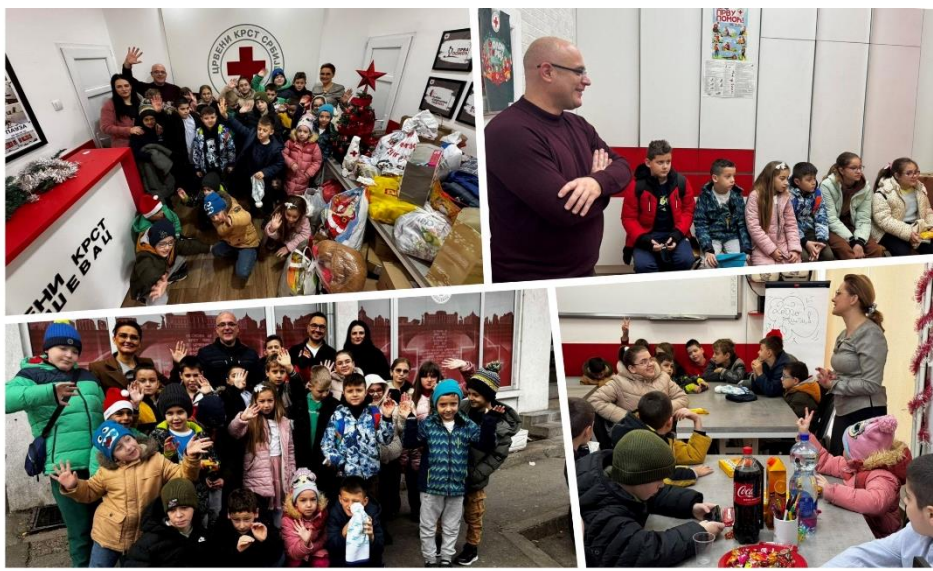
Сегменти са акције „Друг другу“ - Мој генијалац-хуманитарац

Значајан број програмских активности и акција, које су из домена социјалне делатности, Црвени крст Србије спроводи кроз партнерство са Министарством за рад, запошљавање, борачка и социјална питања Владе Републике Србије.